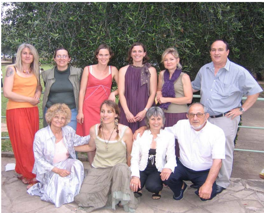
L'Equipe Pédagogique avec l'Adjoint aux Ecoles